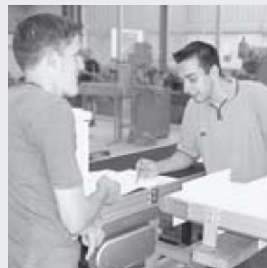
addestramento del vostro personale